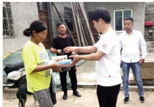
▲认领“微心愿”后购买书包、书籍文具等送到贫困户家中