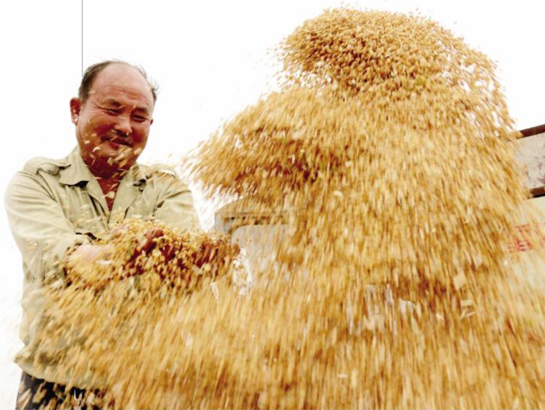
▼小岗村4300亩高标准农田颗粒归仓