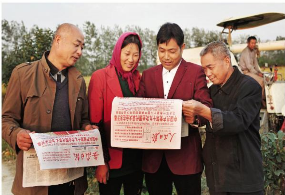
▲天长市的种粮食大户第一时间学习领会十九大精神

透彻深入的宣讲、鲜活生动的解读，让广大干部群众深受教育鼓舞。大家表示，一定要深入学习好、领会好党的十九大精神，真正把思想和行动统一到十九大精神上来，把智慧和力量凝聚到十九大确定的目标任务上来，奋力开启新时代美丽滁州现代化建设新征程。