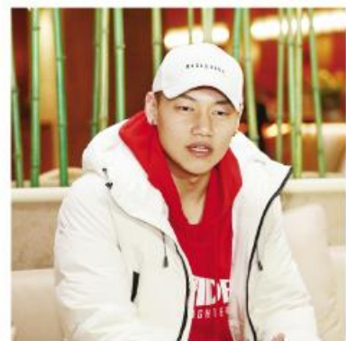
▲采访主创人员和片中演员