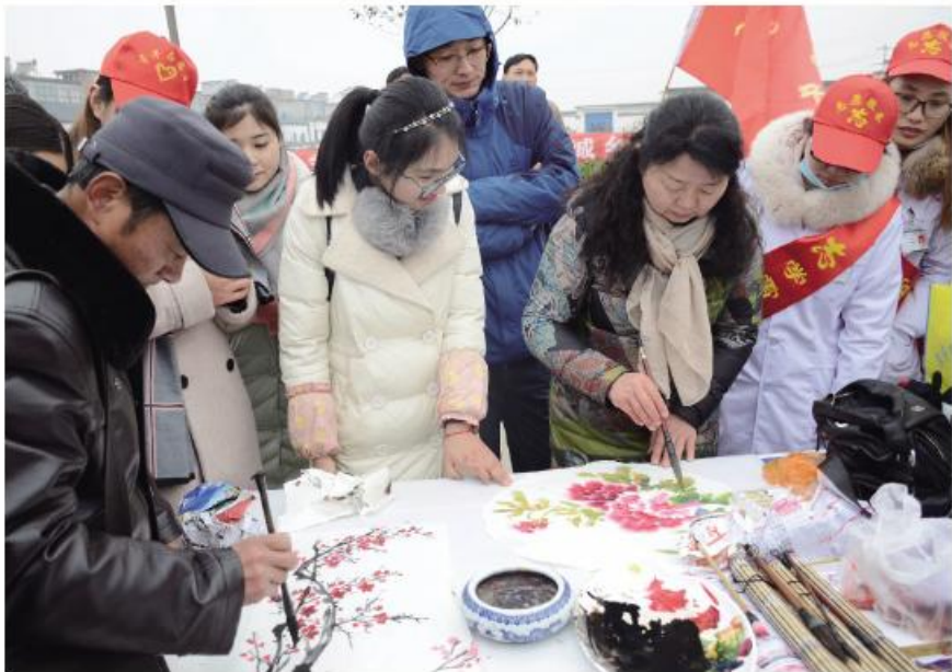
▲文化科技卫生“三下乡”活动现场作画

(五)加大对基层宣传思想文化工作的经费投入。一方面加大对文化硬件设施的投入力度,建设好群众健身广场、乡镇综合文化站、村级农家书屋等,做到有人建有人管。另一方面,保障基层宣传文化部门的工作经费,让更多更好“贴近群众、贴近生活”的作品走进千家万户,惠及人民百姓。