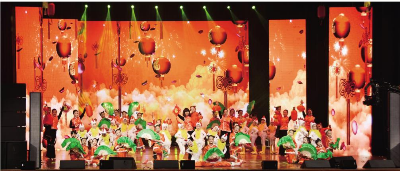
▲定远县春晚