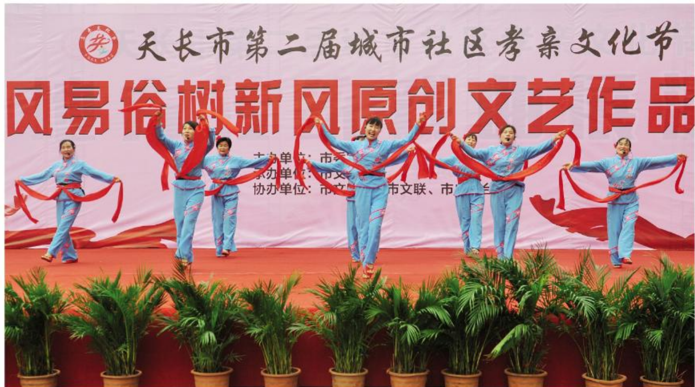
▲天长市第二届孝亲文化节