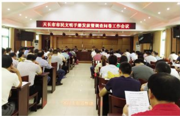
◀ 天长市举办市民文明手册发放、调查问卷培训会

细处着眼、从小处着手、从实处着力,一件一件落实、一项一项推动,让群众从创建中感受到真真切切的变化。为了不放过任何一个细节,消除创建中的盲区死角,实行“路长制”,推进“网格化”管理,开展“行走天长”活动,让党员干部挺在前面,广大市民积极参与,深入到城市的每个角落,更加细致、精准地发现和解决影响群众生活的问题。创建以来,共下发整改督办单1600多份,交办问题2300多个,曝光问题500多个。