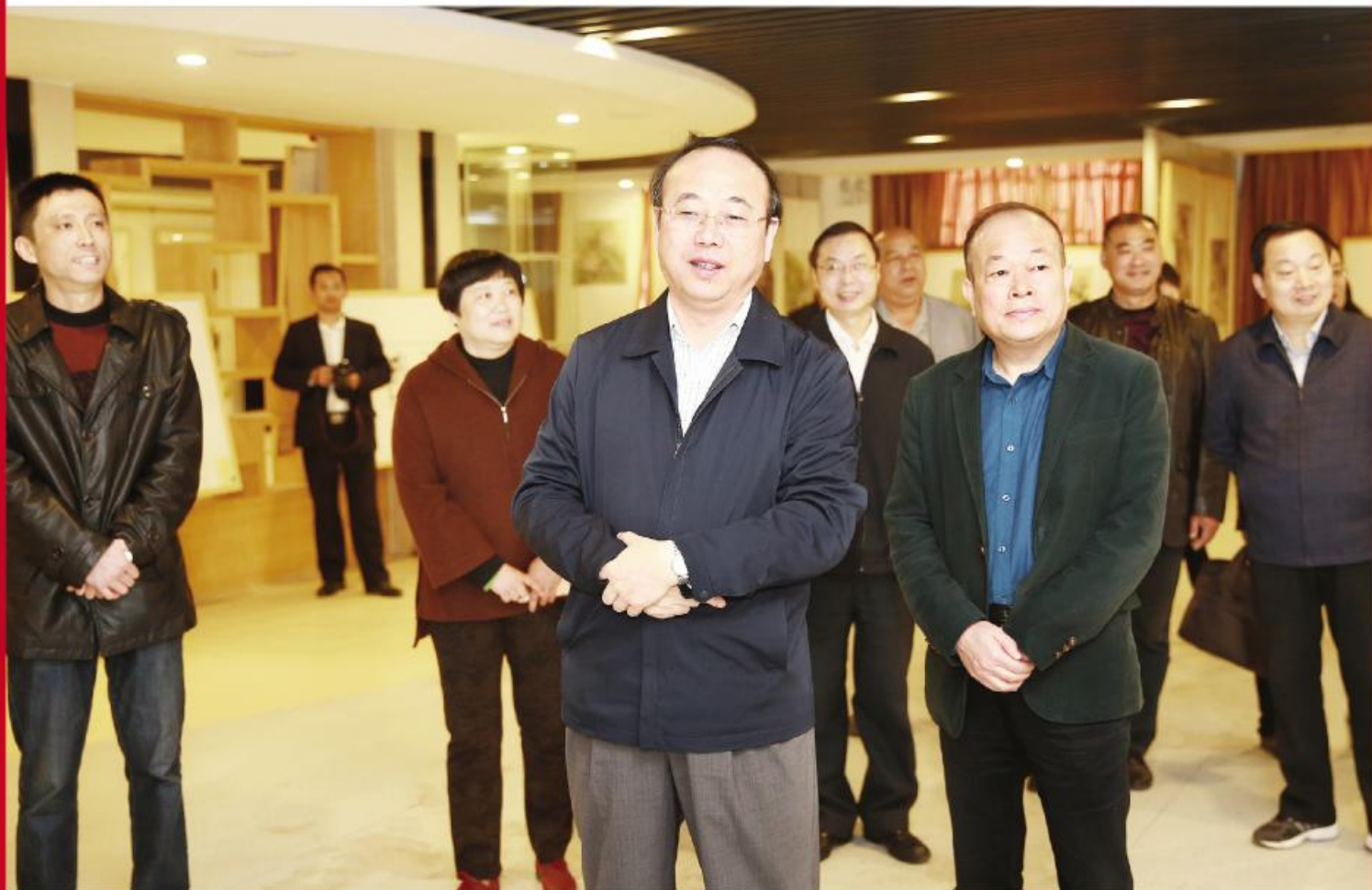
张祥安深入滁州市文化馆调研