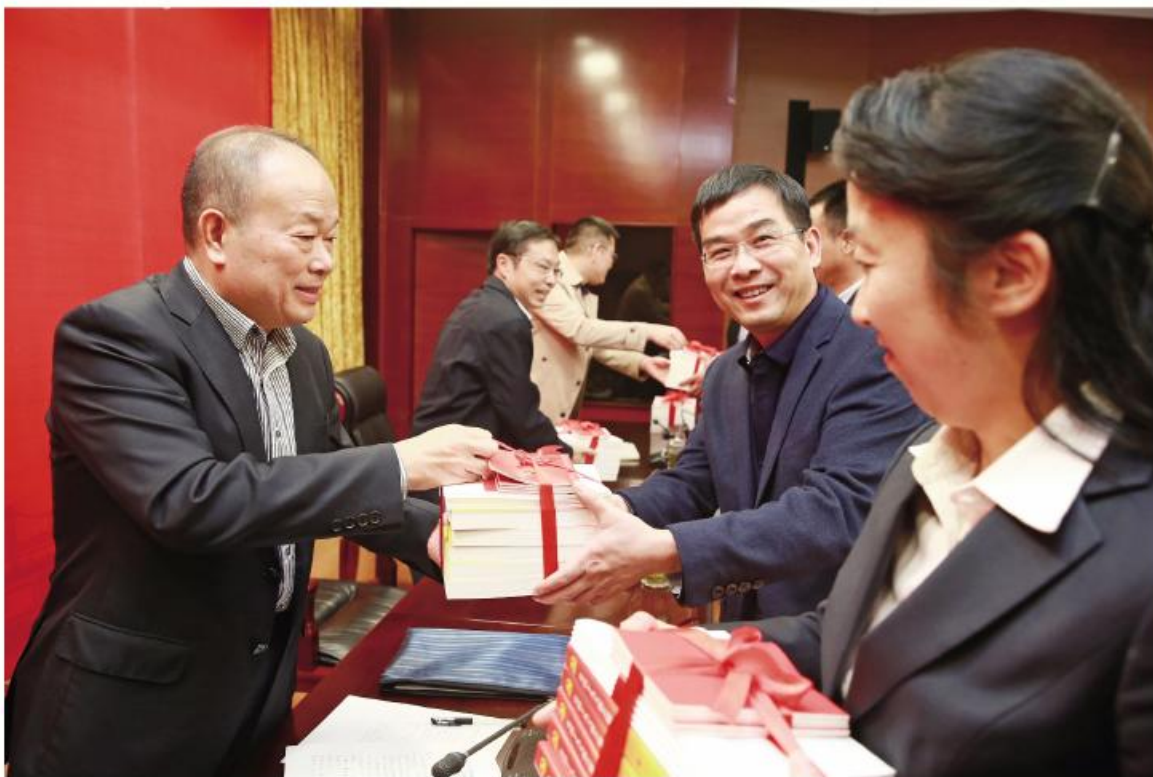
▶赠送学习辅导读物

首发式上,向机关、企业、 社区等基层党组织代表赠送 了党的十九大文件及学习辅 导读物。(卢志永)