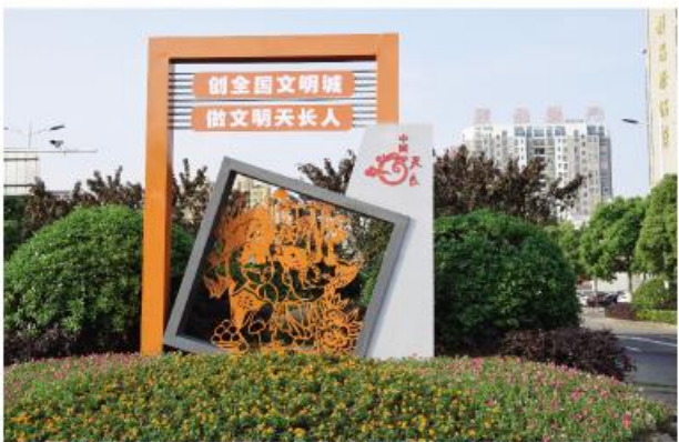
◀ 主要路段设置公益广告城市小品