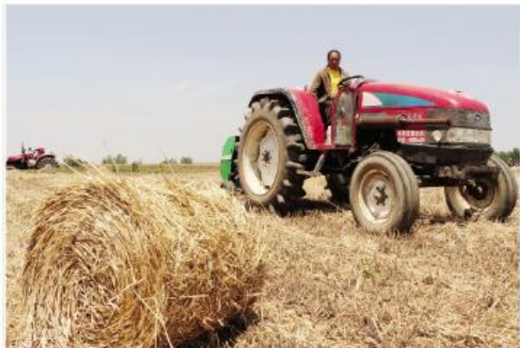
▲村民正在秋收农机作业