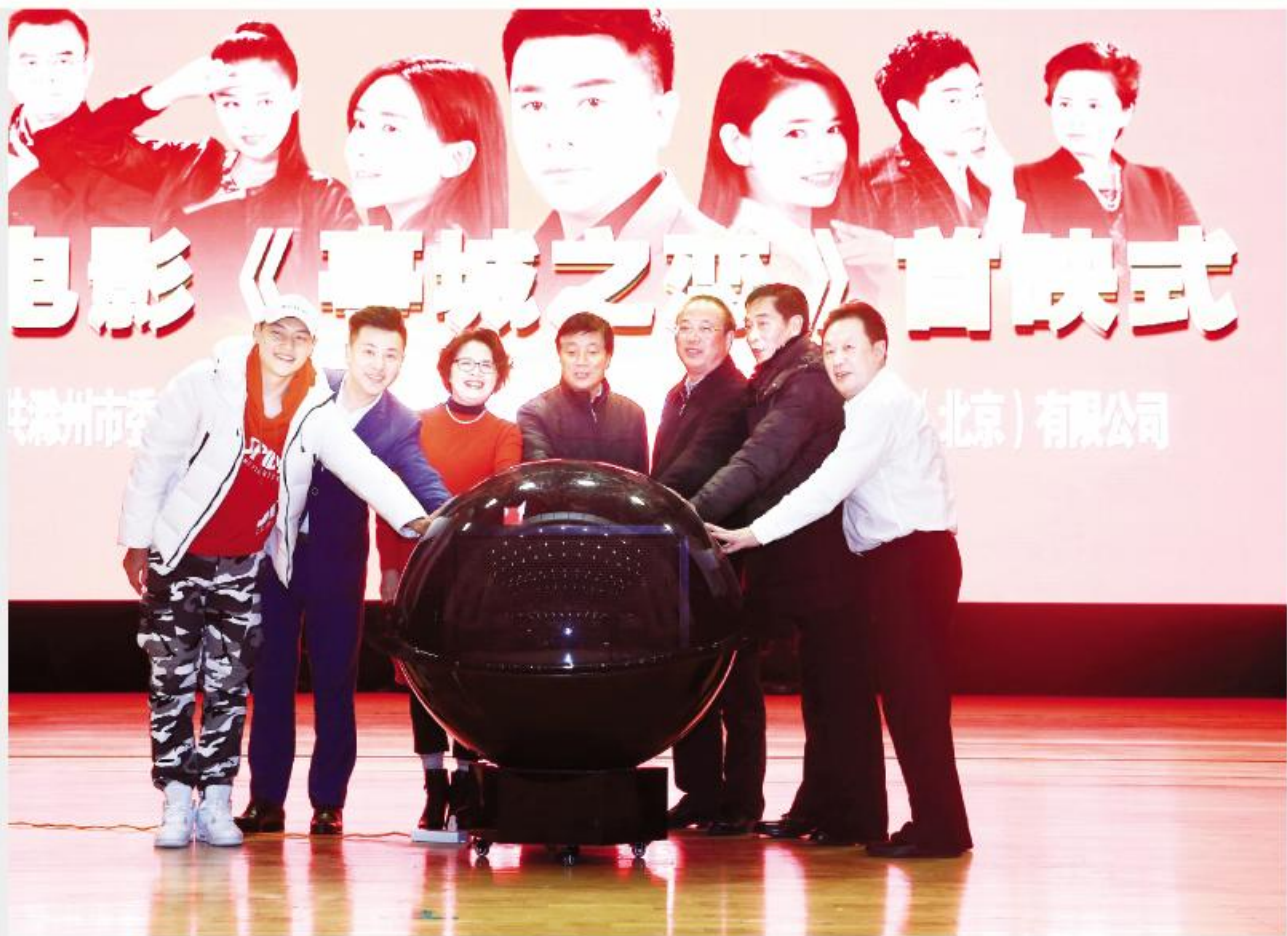
▲市委书记张祥安与嘉宾共同按下启动球

12月15日,由滁州市委宣传部和中广视线影视传媒联手为滁州量身定制的电影《亭城之恋》在滁首映,还将登陆全国各大影院并有望在央视6套播放,向全国展示滁州的山水之美、城市之美和人文之美。