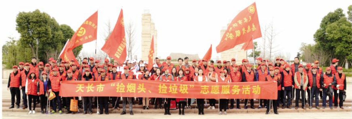
▼ 天长市开展捡烟头、捡垃圾志愿服务活动