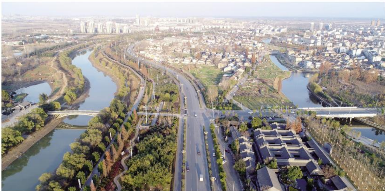
▲襄河水利风景区