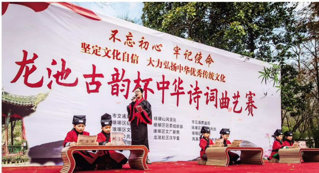
▲社区举办诗词曲艺赛