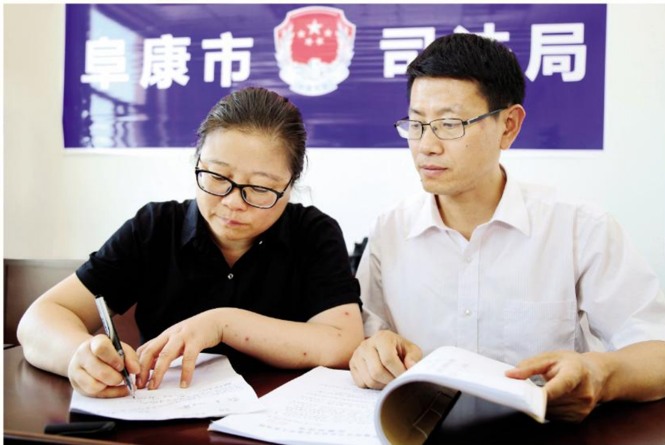
▲第六届全国道德模范陈贤、曹旭夫妇