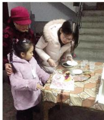
▲爱心网友为武店镇贫困女童送上生日蛋糕

通过政务新媒体“圆梦微心愿”网络扶贫公益活动的开展,让更多的社会网友可以参与到扶贫攻坚行动中,倡导了助人为乐、扶贫济困的传统美德,积聚了网络社会正能量,为地方党委、政府深入推动“精准扶贫”工作发挥了有益的补助作用。