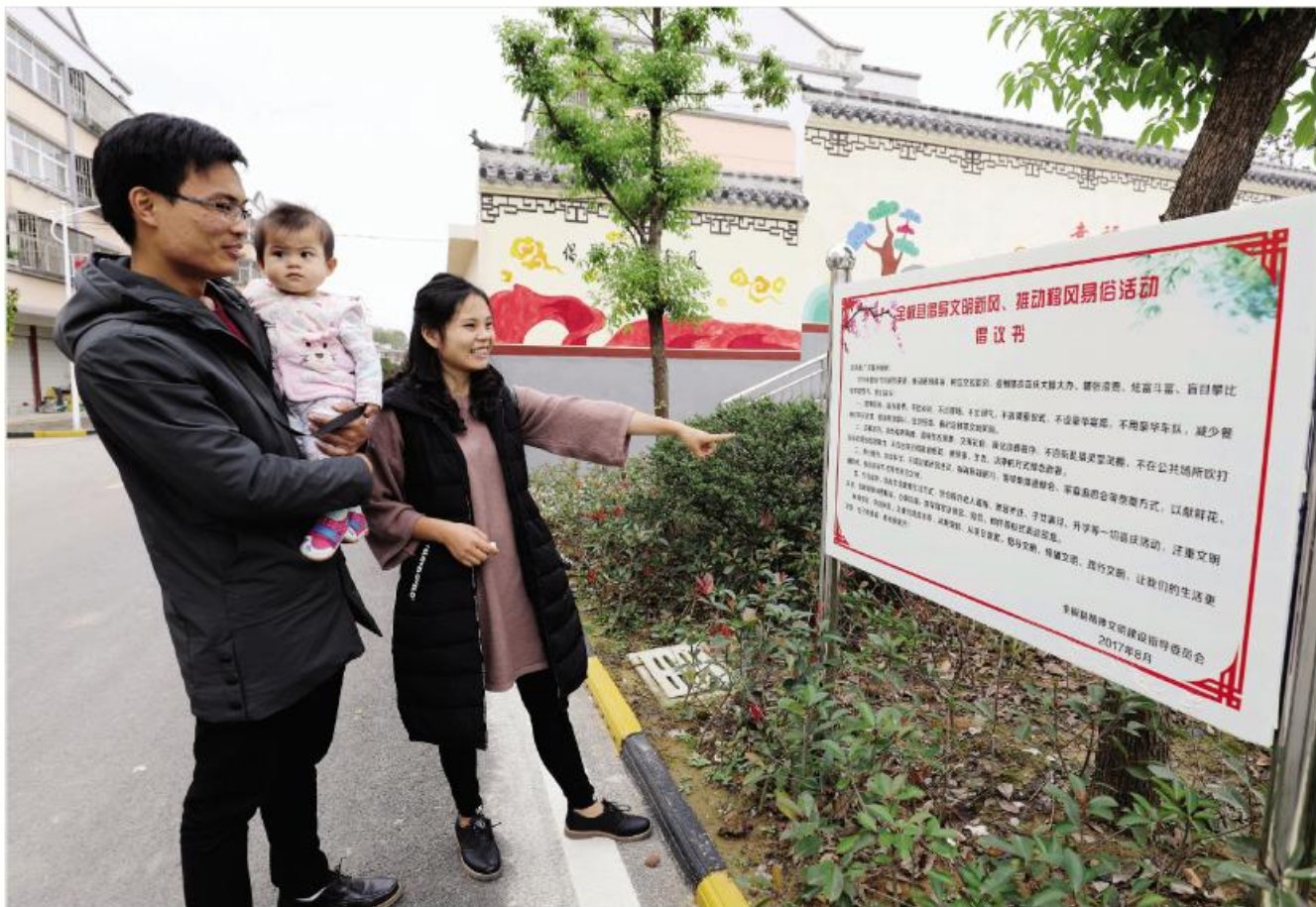
▲全椒县武岗镇武岗新村居民观看倡导文明新风、推动移风易俗活动倡议书