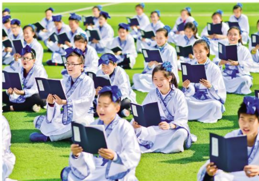
▲国学经典诵读

积极开展系列主题宣传教育活动。宣传、教育、文化部门以及工会、共青团、妇联等群团组织密切配合，在春节、重阳、中秋、端午、清明等中国传统节日来临之际，以广大人民群众和中小學生喜闻乐见的形式，开展传统文化教育活动和体验活动；广泛开展优秀传统文化经典导读、演讲故事比赛、评选“国学少年”等活动。以活动引领推动，打造琅琊区弘扬优秀传统文化品牌，为各校传承工作提供最有力的支撑，让中华优秀传统文化在校园落地生根。