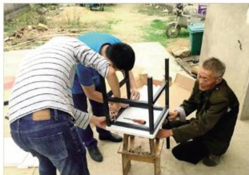
▲志愿者将网友购买的家具送到贫困户家中并现场安装