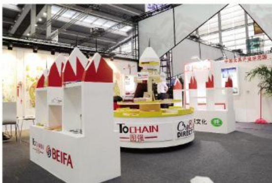
▲深圳文博会滁州展区

近年来,在省委宣传部的有力指导下,滁州市认真贯彻落实各项决策部署,不断创新机制,攻坚克难,文化产业发展取得较好成绩,呈现出蓬勃发展新局面,省政府目标绩效文化产业考核连续三年进入全省第一方阵。