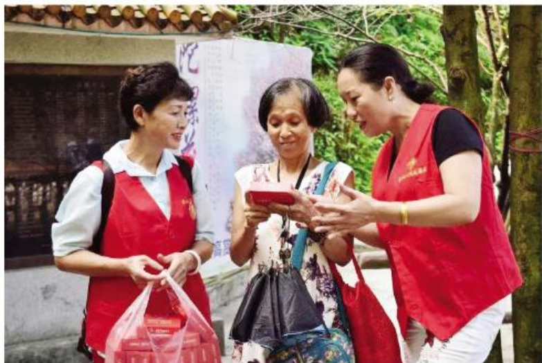
▲ 免费发放宣传纸巾劝导游客文明参观、爱护环境

区工作者+志愿者”、“互联网+志愿服务”模式,招募使用志愿者,发布志愿服务项目,引导居民群众参与学雷锋志愿服务活动,目前全市注册志愿者达66万余人,在城区社区、窗口单位、物业小区设立志愿服务站(岗)1500多处。注重文明城市创建与文明细胞创建相结合,广泛开展文明单位、文明科室、文明社区、文明家庭、文明庭院、文明楼栋等文明细胞创建活动。