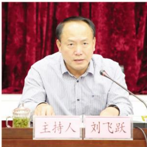
▲省委宣传部副部长刘飞跃

为纪念改革开放40周年，牢记两年前习近平总书记视察安徽时的嘱托，4月25日，“践行新思想·建设新安徽”论坛“小岗精神与乡村振兴”研讨会在凤阳县召开。省委常委、宣传部长虞爱华出席会议并讲话，市委书记张祥安致辞，省委宣传部副部长刘飞跃主持会议。研讨会由省委宣传部主办，滁州市委、凤阳县委承办。