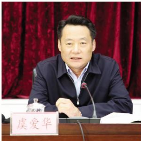
▲省委常委、宣传部长虞爱华