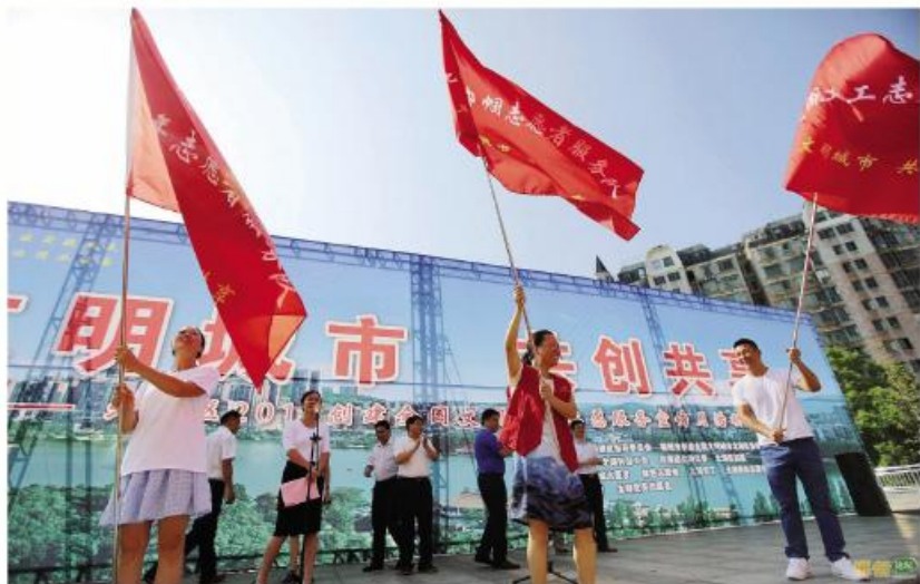
▲创建全国文明城市志愿服务宣传月活动现场