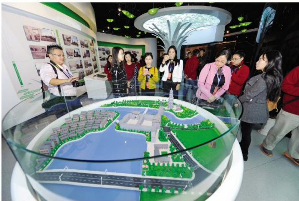
▲东盟十国主流媒体聚焦滁州

党的十九大作出的中国特色社会主义进入新时代的重大政治论断，将习近平新时代中国特色社会主义思想确定为党的指导思想，对党和国家事业发展进程具有里程碑意义，是我们做好外宣工作的根本遵循。立足新起点，紧跟新时代，推进滁州对外宣传工作实现新作为，要坚持一个“准确把握”、三个“有”。