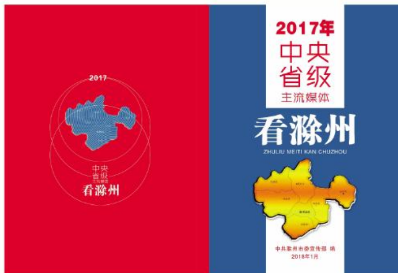
▲中央省级主流媒体看滁州封面 魏星/设计