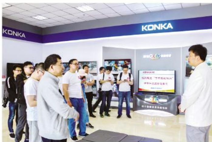
▲自媒体采风团在安徽康佳电子有限公司参观

二、新老媒体相结合,唱响滁州好声音。新媒体传播手段多、影响力大。在本次采风中,自媒体达人充分利用抖音短视频平台,进行了大量的内容创作。在琅琊山景区、长城影视园、吴敬梓故居、盼盼食品等地先后创作拍摄了20多条15秒抖音短视频。其中,仅在长城影视城拍摄的一条短视频,在抖音APP上就收获了超40万的阅读量和超3万人的点赞,对滁州起到了良好的宣传推介效