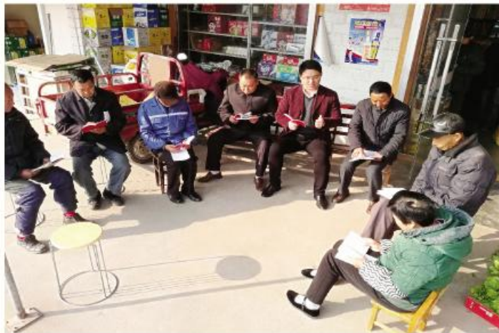
▲来安县独山乡「小板凳」宣讲团「进农家」