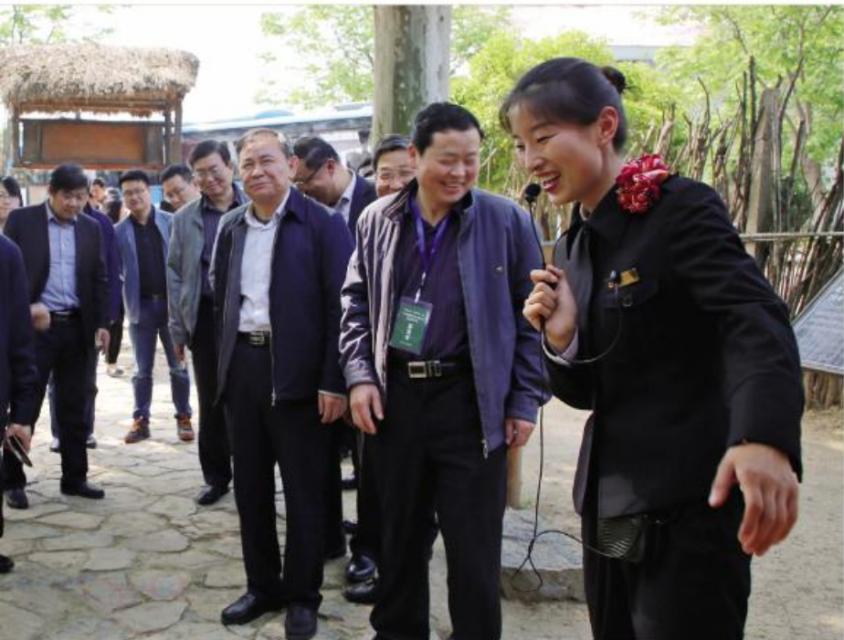
▲参会人员参观当年农家

小岗精神首先是“敢为人先”的大包干精神,实际上就是一种改革创新精神,这是小岗精神的核心和灵魂。自小岗村大包干以来,我省始终秉持敢为人先的改革创新精神,引领农村改革一直走在全国前列。下一步,我们将进一步弘扬敢为人先的小岗精神,牢固树立创新发展理念,通过深化改革,推动机制创新、产业创新,增强乡村振兴强大动能。一是着力在创新农业经营机制上下功夫,二是着力在激发农村要素活力上下功夫,三是着力在创新农业产业形态和模式上下功夫。我们将按照习近平总书记提出的乡村“产业振兴、人才振兴、文化振兴、生态振兴、组织振兴”五个振兴要求,积极探索、大胆实践、勇于创新,努力推动我省乡村振兴走在全国前列。