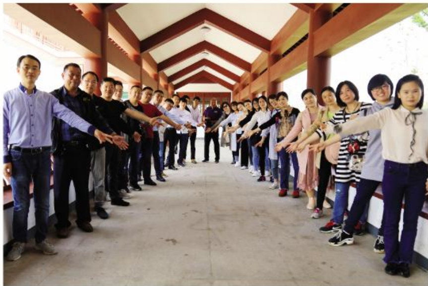
▲网友看明光

光”等系列微视频和精美图文,生动形象地宣传“美丽家园”建设新成就;组织网络大V、网站版主等开展系列“网友看明光”活动,在官微开展“创建随手拍”有奖征图、“送门票”“免费品美酒”等活动,提高网友与官微互动的积极性、有效性。“明光发布”官微连续两年荣膺“安徽年度十大突破力政务新媒体”、“安徽优秀政务微信公众号”等称号,稳居全省政务微博微信综合影响力排行榜第一方阵。三是真心服务网媒网民。紧跟网络时代潮流,不断提高服务网民的能力和水平,真正深入群众,听取网民意见建议,帮助网民解决问题。创新“指尖上的政务”,在官微“明光发布”开辟“小编跑腿”栏目,对网友的意见和关注的难点热点问题,及时@有关部门帮助解决,实现小编跑腿、部门办事、网民“阅卷”,真正将引导网民寓于服务网民之中。四是凝心聚力同向同行。在网络空间把网民拧成一股绳,用习近平新时代中国特色社会主义思想、社会主义核心价值观和“中国梦”广泛凝聚共识,让网民不被其他歪理邪说所入侵、所绑架,使之始终与党同心同德、同向同行,共同为实现中华民族伟大复兴而奋斗。