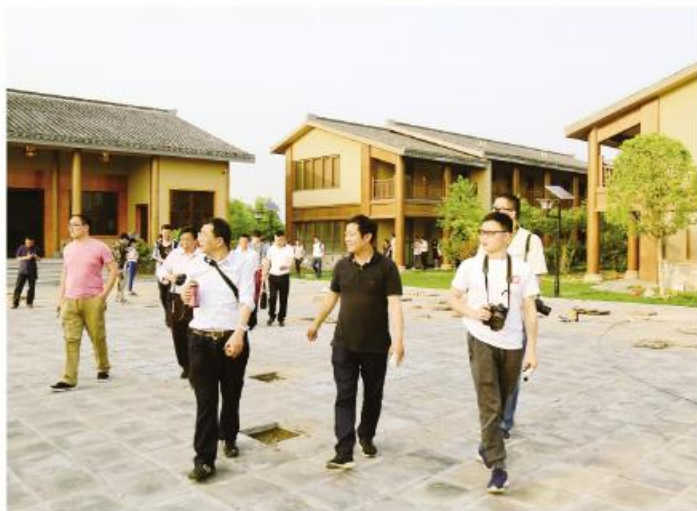
▲自媒体采风团在安徽荣鸿生态农业示范园参观