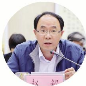
滁州市委常委、 副市长 赵 鲲