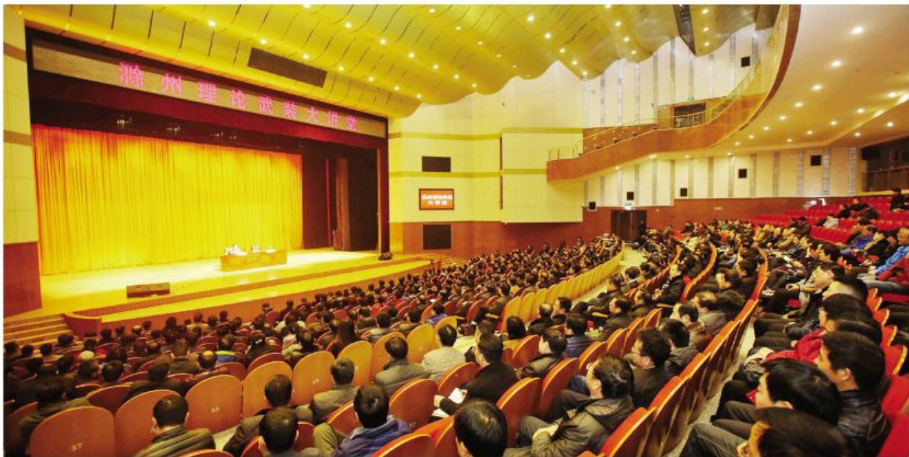
▲滁州理论武装大讲堂