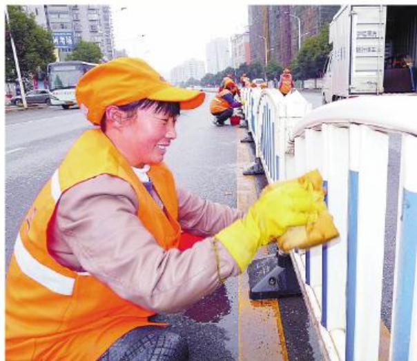
▲环卫部门加大对街道的清洗、保洁力度