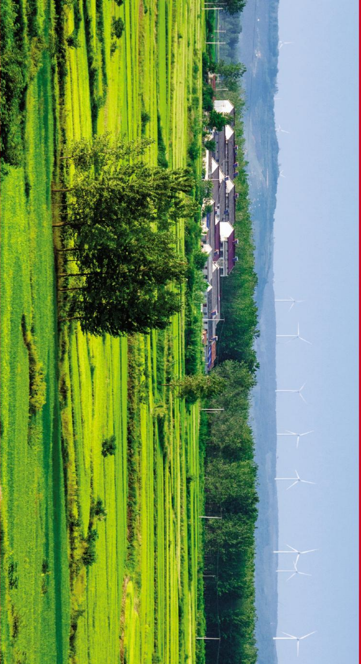
《风车下的农庄》