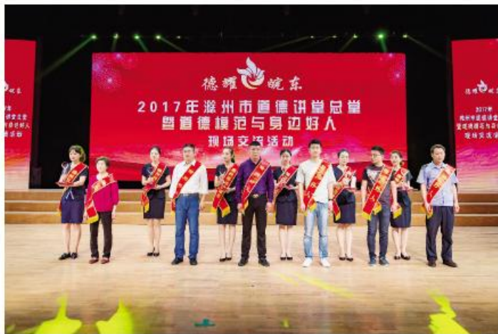
▲滁州市道德讲堂总堂活动现场

化,为市委、市政府决策提供参考。宣传推介“滁州经验”。策划开展“正风反腐促发展”“供给侧改革”“聚焦战略性新兴产业集聚发展基地”“五大发展见行动”等主题宣传100场;创新开展天长市秦栏镇“孝亲艺术节”、杨村“书法锦杨村”、来安县永阳花灯汇暨花灯大赛、桃文化旅游节等极具地方特色的群众文化全媒体直播活动100场。中国农民歌会六度在滁唱响,天长成功创建全国文明城市,南谯区乌衣社区建成全市首家“寿星馆”,获全国“尊老爱老”模范社区荣誉称号,定远县蒋集镇农家书屋受到国务院副总理刘延东的批示肯定等等,这些都是中国特色社会主义和中国梦在滁州的成功实践和转化,扩大了滁州对外影响。