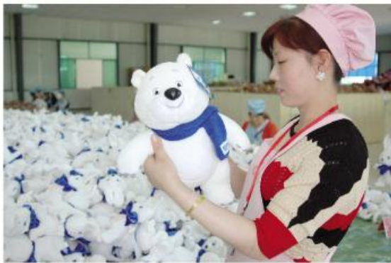
▲长兴玩具生产的冬奥会产品