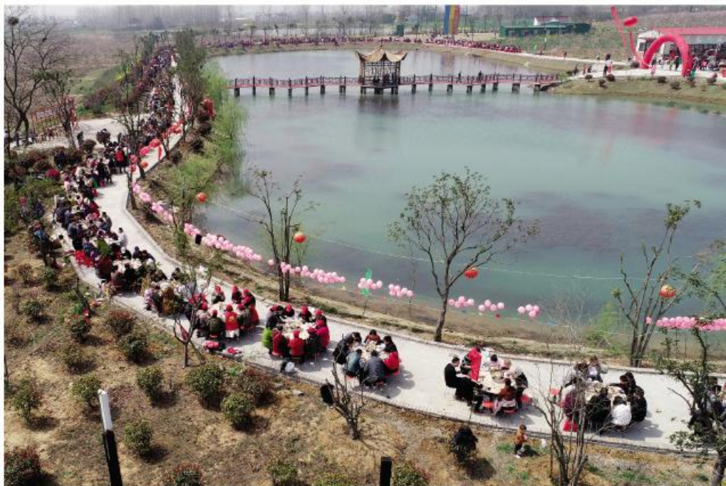
▲游客在全椒大墅龙山桃花节上参加“千人宴”活动

目前滁州境内的成片桃园主要集中在全椒、来安、定远、南谯、明光等五大片区,除了全椒县二郎口镇的程家市桃园、大墅镇的龙山桃园和来安县张山乡的仰山桃园,另外三处分别为定远县界牌镇的德胜集桃园、明光市涧溪镇的九塘村桃园以及南谯区的皇甫山桃园和黄泥岗桃园等。根据季节特点,“滁州桃文化旅游节”包含赏花篇、采摘篇两个组成部分,按桃树的生长特点在一年中依次举办。