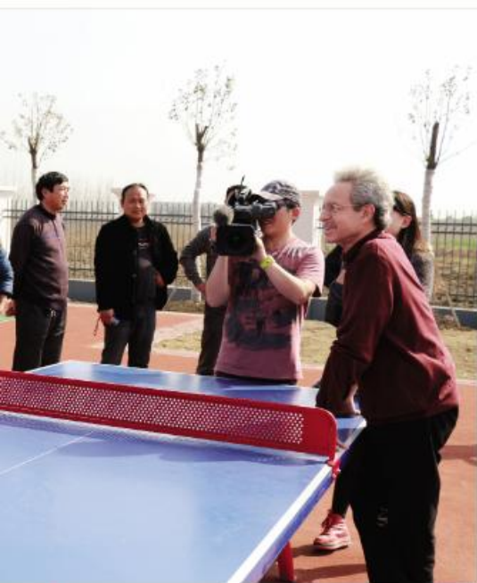
▲上海电视台外语频道采访小岗村

型,做小故事切口,力求小体裁做大、大体裁做高、好素材做亮。在媒体对接上,要做好“沟通上情、把握下情、当好中枢、精准对接、跟踪服务”五个重要环节,同时瞄准兴奋点、跟上敏感点、精准策划亮点。在关键环节上,要做好基础工作,对区域内的亮点、特色要了然于胸、如数家珍,积极做好组织、策划、加工、提升、推出工作;要加强协调调度,坚持平台共享、信息共谋、形成合力、共同发力;要完善采访流程,