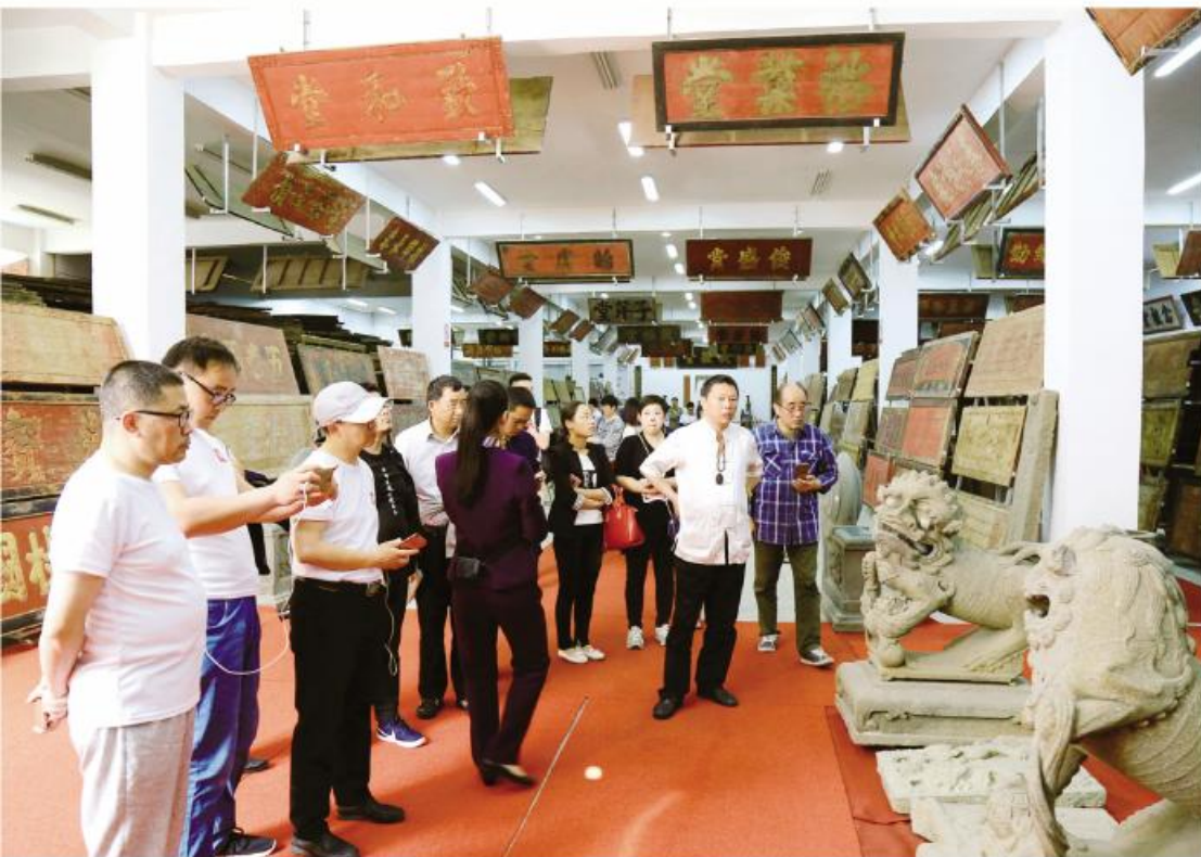
▲自媒体采风团在中国金丝楠木博物馆参观

果。除此之外,本次采风活动还通过开设“了不起的滁州”专题、制作高清品宣美图、网络图文直播、快闪短视频、无人机航拍、H5、深度稿件等多种形式对活动进行全程报道,将争当“五个先行者”的现代化新滁州的崭新风貌与深厚的历史文化底蕴表现的淋漓尽致。传统媒体全程参与,助力了了不起的滁州。此次采风活动中,滁州日报、皖东晨刊等传统媒体也全程参与其中,通过与各网络大V互动交流、实地采访,进一步扩大了“了不起的滁州”全媒体采风活动的影响力,为传播滁州好声音贡献力量。活动结束后,滁州日报于5月2日和5月4日分别在头版和综合新闻中刊发了活动报道,皖东晨刊于5月2日对此次活动进行了跨版报道。与此同时,滁州网、滁州广播电视台、E滁州、嗨滁网等滁州本地网站论坛也对此次活动进行了宣传报道,使得活动的影响力进一步得到提升。