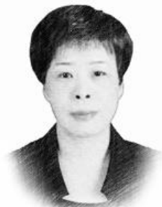
中共琅琊区清流公共服务中心 党工委书记、主任