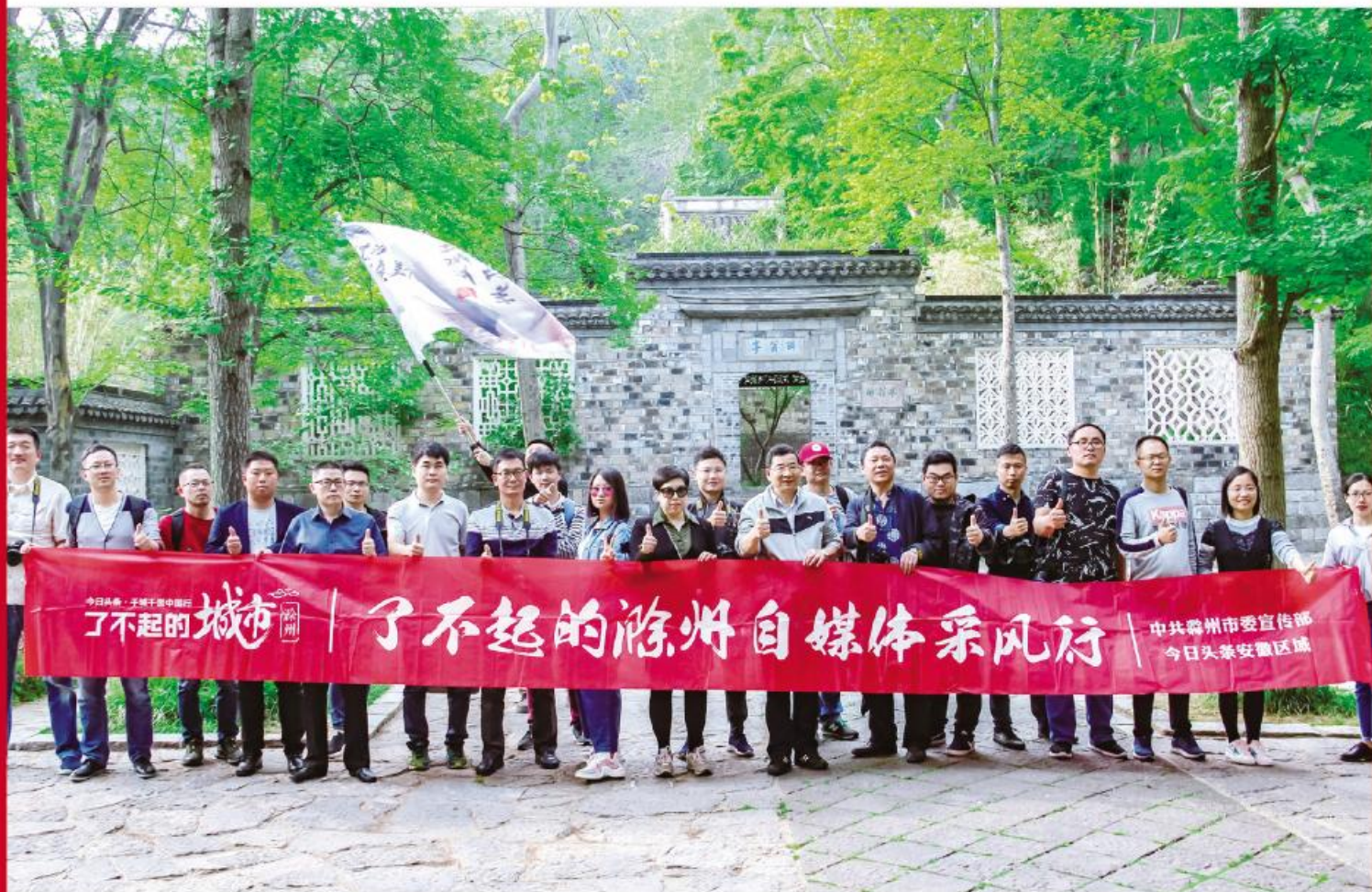
“了不起的滁州”自媒体采风团在醉翁亭前合影