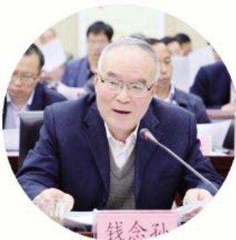
省政府参事、 省社科院研究员 钱念孙